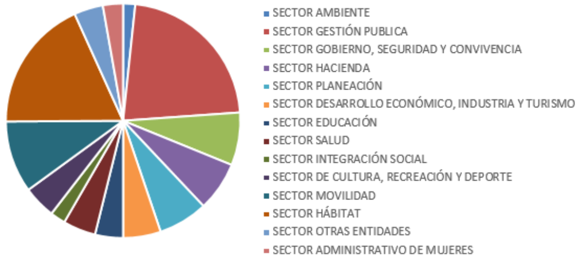
Promedio Consumo Per Cápita de Agua 2008 - 2014